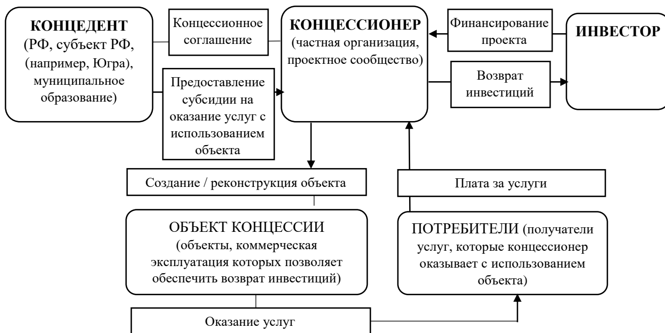
Рис. 4. Схема реализации концессии

При заключении концессионного соглашения в отношении объектов социальной инфраструктуры (в частности объектов отрасли социального обслуживания), подведомственных Депсоцразвития Югры, концедентом будет выступать Депсоцразвития Югры как уполномоченный орган субъекта автономного округа. Объектами концессионного соглашения в данном случае будут являться объекты социального обслуживания граждан (здания, инженерные сети и пр.)