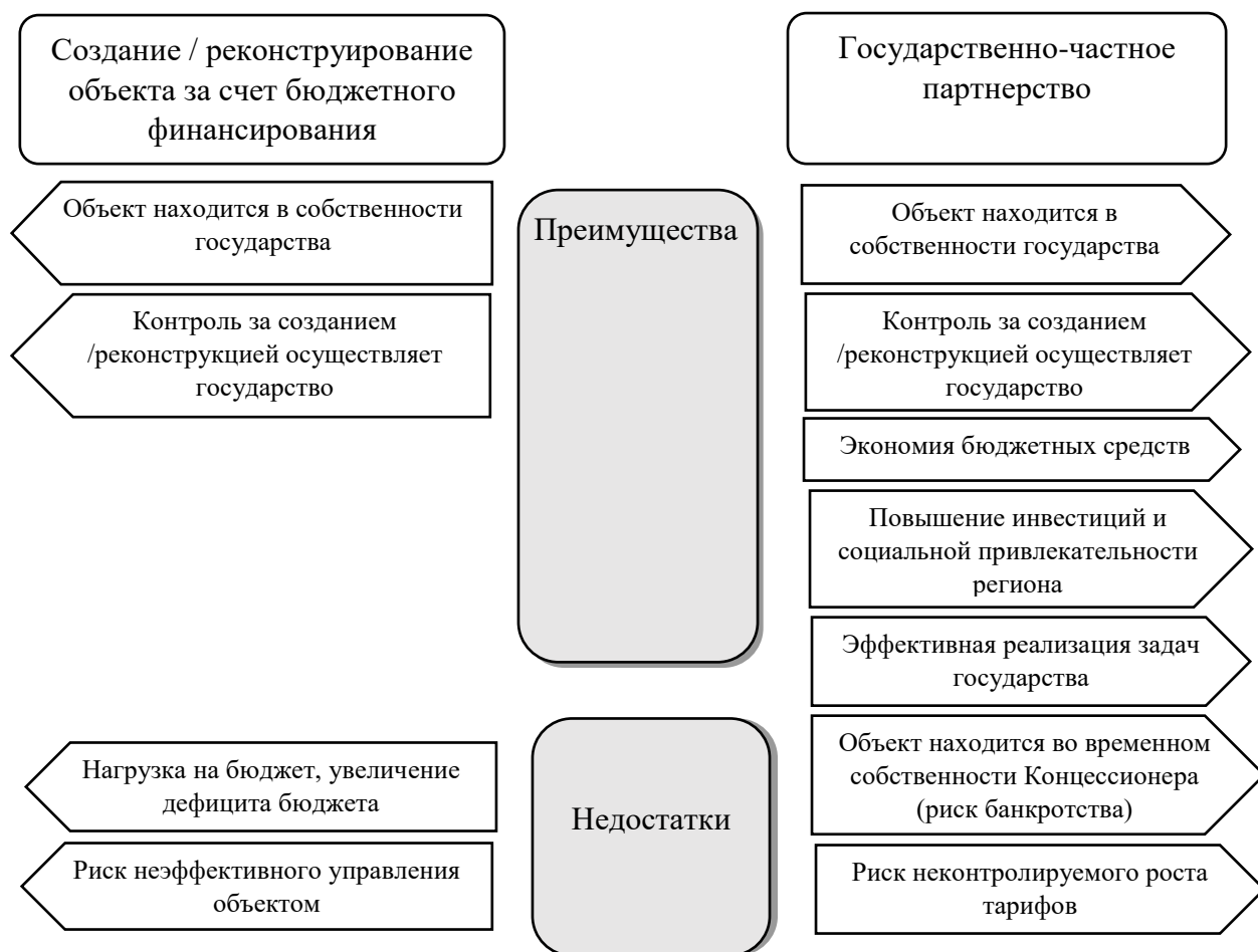
Рис. 3. Преимущества и недостатки концессионных соглашений

Одним из примеров использования механизма использования концессионной модели в социальной сфере автономного округа является