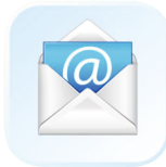
Электронная почта (E-mail)