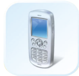
Мобильный телефон (SMS)