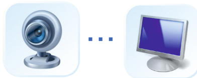
Web - камера (Skype)