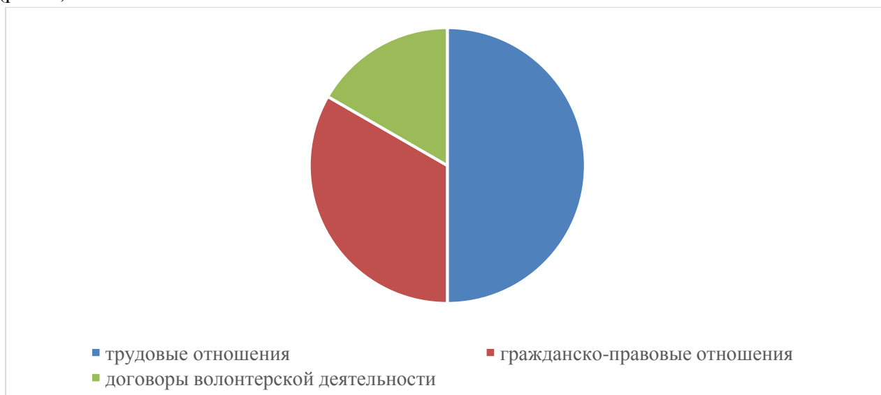
Рис. 2. Формы трудовых отношений, чел.

В Центре работают по трудовым договорам 6 специалистов, из них 3 специалиста являются внешними совместителями, организация заключила 4 договора возмездного оказания услуг (рис. 2).