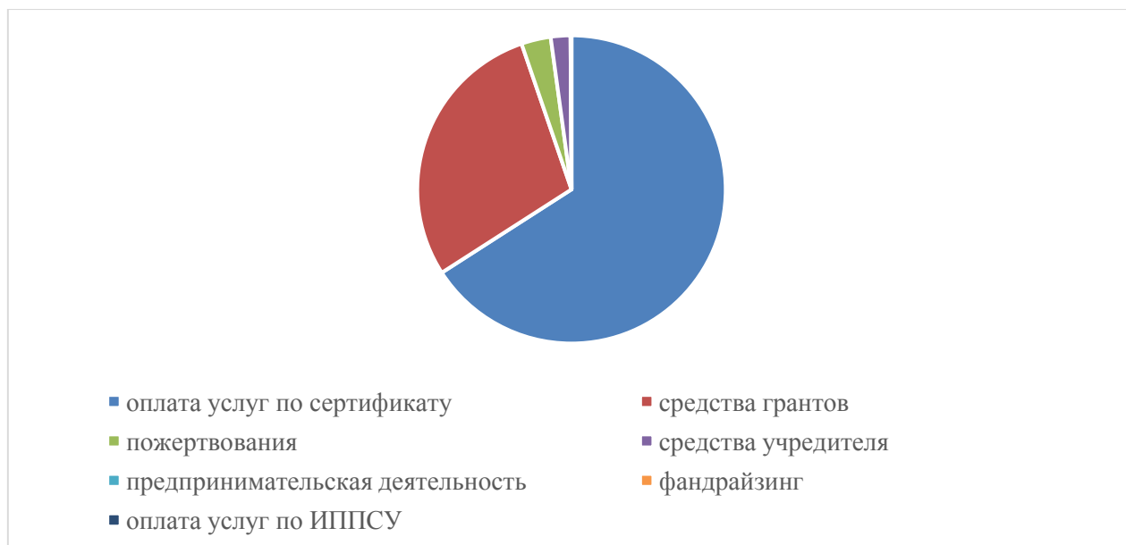
Рис. 1. Способы привлечения финансирования в 2019 году, %.

Анализируя материально-техническое обеспечение организации, как вторую составляющую имущественных ресурсов, рассматривается этап формирования материальной базы (Центр зарегистрирован в Министерстве юстиции в июле 2018 года). На основании договора аренды нежилого помещения организация размещается в помещении ООО «Центр детского развития «УМКА». Условия размещения организации соответствуют требованиям к деятельности поставщиков социальных услуг. Помещения полностью оборудованы: на средства гранта приобретены оргтехника, мебель, дидактические комплексы для использования в рамках «Школы приемных родителей». Информация о материально-техническом оснащении размещена на официальном сайте организации. Необходимо отметить, что организация арендует помещения по коммерческим ценам, а стоимость сертификатов не покрывает затраты на аренду. Для Центра существенную помощь в затратах на аренду оказывает реализация проектов.