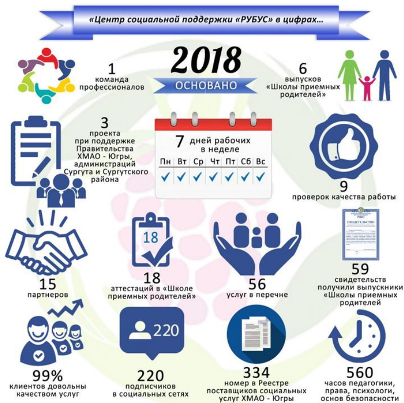
Рис. 3. Инфографика «Центр «РУБУС» в цифрах.